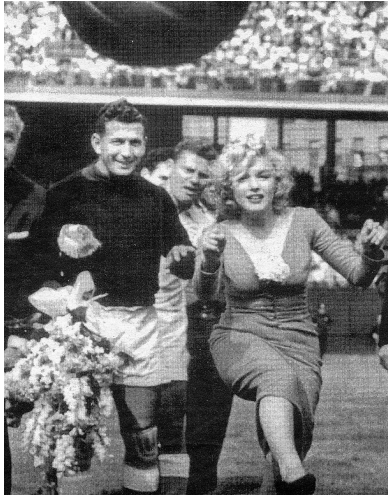
Saque de Honor en el Yankee Stadium en 1957