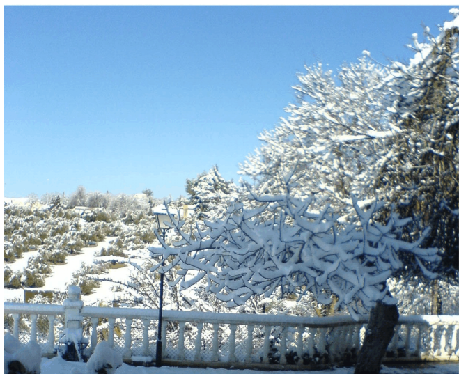
La Yedra (Jaén), 28.I.06