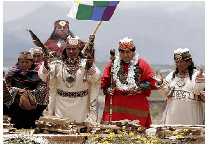
Evo Morales, sin jersey, con ropajes indios de ceremonia en 2006