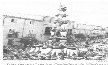
"Tres de nou" de los Castellers de Vilafranca