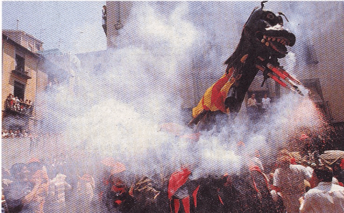
PATRIMONIO DE LA HUMANIDAD. La Unesco declaró ayer la fiesta de la Patum de Berga como obra maestra oral e inmaterial de la humanidad, una distinción que en España sólo tenía el Misteri d'Elx. La Vanguardia, 26.XI.05

Extraño animal. - Al llegar los primeros británicos a Australia se quedaban asombrados de ver los marsupiales.- Siguiendo su norma, a cualquier indígena próximo le preguntaban "What's that?" y los indígenas solían responder " Ka'nguro ", de donde le vino el nombre.- Sólo años más tarde se descubrió que "Ka'nguro" significaba "no entiendo nada".- (Onda Cero, 10.XI.04)