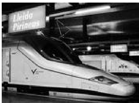
Nuevos AVE "pato", de Talgo-Bombardier

¿Tiene Ud. apartamento alquilado para este verano? Nuestra asociada A.M.N.S.A. se lo facilita en Salou/Cambriis y puede Ud. verlo durante Semana Santa.-