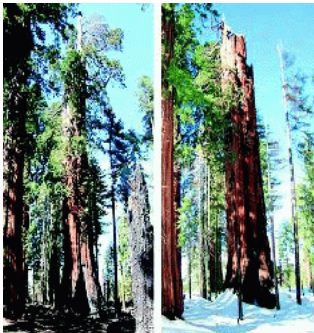
Muere, a los 3.000 años, la secuoya segunda más grande

¿Tiene Ud. apartamento alquilado para este verano? Nuestra asociada A.M.N.S.A. se lo facilita en Salou/Cambriis y puede Ud. verlo durante Semana Santa.-